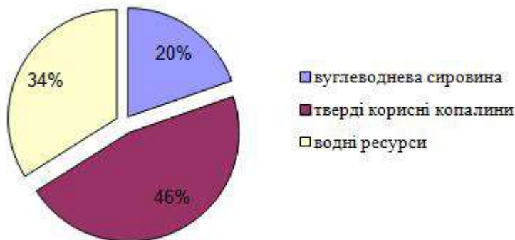
Мал. 1 – Розподіл укладених договорів за видами корисних копалин у 2012 р.

За видами корисних копалинах опрацьовані у 2012 році договори розподілені, як показано на малюнку 1.