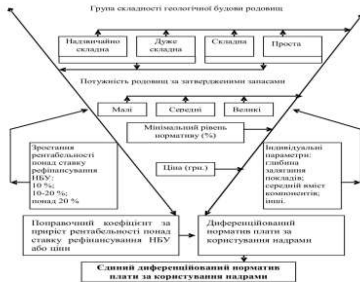
Рис. 2. Каскад гірничо-геологічних та економічних параметрів диференціації нормативів плати за користування надрами

Об'єктом справляння плати за користування надрами для видобування корисних копалин є обсяг фактично виробленого першого товару з видобутих корисних копалин, розмір ділянки надр, що надається в користування при використанні їх у цілях, не пов'язаних з видобуванням корисних копалин, зокрема для будівництва та експлуатації підземних споруд.